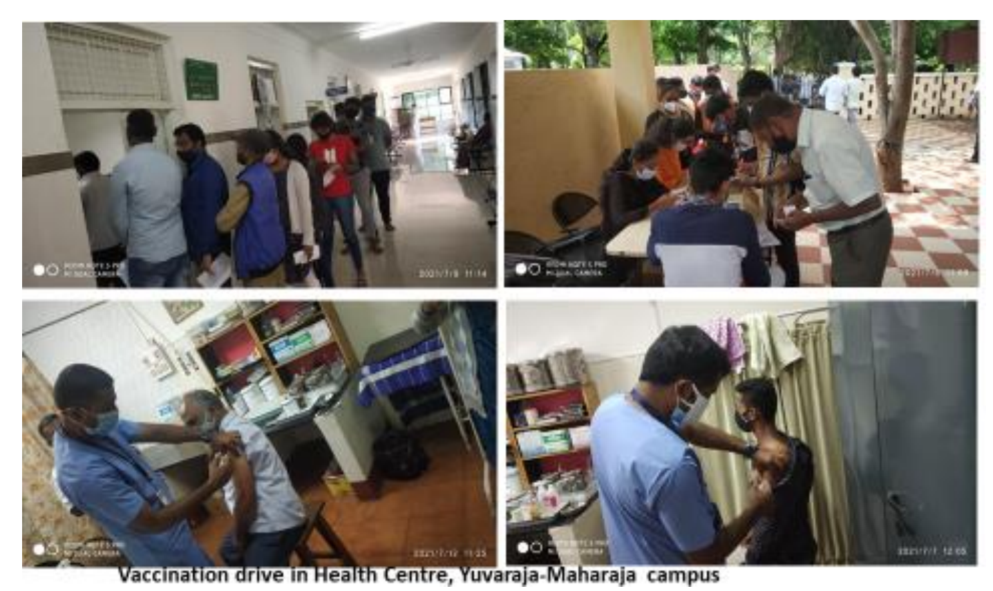
Over 6000 Teaching, non-teaching staff, family members, students, research scholars got vaccinated first and booster dose.